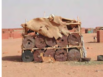
Récupération de ferrailles pour l'habitat, maison d'un ancien travailleur des filiales d'AREVA (source : CRIIRAD, déc. 2003)

Les investigations conduites par la CRIIRAD, en décembre 2003, à l'aide d'un petit radiamètre, dans le cadre de la formation dispensée aux membres d'AGHIR IN MAN ont permis de mettre le doigt sur un problème très sérieux : la dispersion des ferrailles contaminées . Compte tenu du niveau de vie très bas de la population nigérienne, tout est susceptible d'être récupéré et utilisé pour la construction des maisons, de l'outillage, des ustensiles de cuisine, etc.