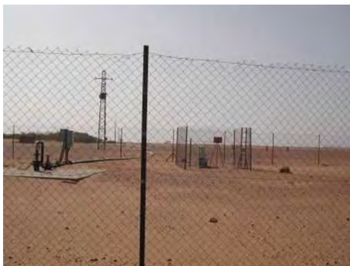
Puits 2002 (ARLIT) / CRIIRAD, décembre 2003

Pourtant le communiqué de presse COGEMA-AREVA du 23 décembre 2003 mentionnait l'« absence de contamination (des eaux) » et le dossier de presse AREVA au NIGER de février 2005 téléchargeable sur le site Areva précisait encore page 10 au paragraphe sur l'eau : « Les analyses bactériologiques (mensuelles), radiologiques (semestrielles) et chimiques (annuelles) montrent l'absence de contamination ».