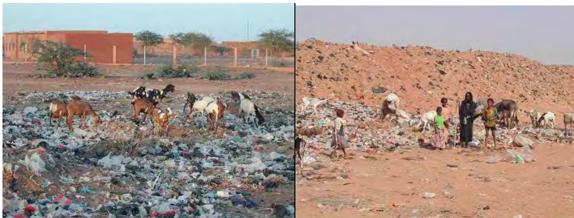
Conditions de « stockage » des ordures ménagères en périphérie d'Arli et Akokan

De plus, les eaux usées des villes sont utilisées pour irriguer les jardins d'Arli. Le traitement préalable consiste en un simple lagunage via 5 ou 6 bassins de décantation.