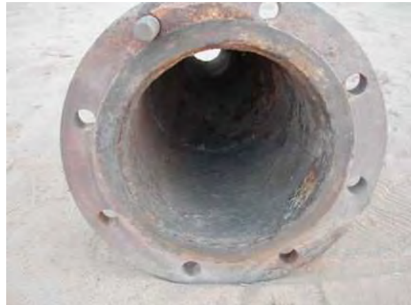
Repérage d'une tuyauterie radioactive sur le marché à Arlit (Mesures CRIIRAD de décembre 2003).

Les contrôles effectués en avril 2007 par deux étudiantes 6 permettent de confirmer que des ferrailles contaminées et irradiantes sont en fait toujours présentes par exemple chez un ferrailleur 7 ou dans des lieux habités. Les compagnies minières n'ont soit pas mis en œuvre soit de façon inefficace la recommandation formulée par la CRIIRAD en 2003 : le lancement d'une grande campagne d'information et de détection radiométrique permettant de repérer, de racheter et d'isoler les ferrailles contaminées détenues par des particuliers.