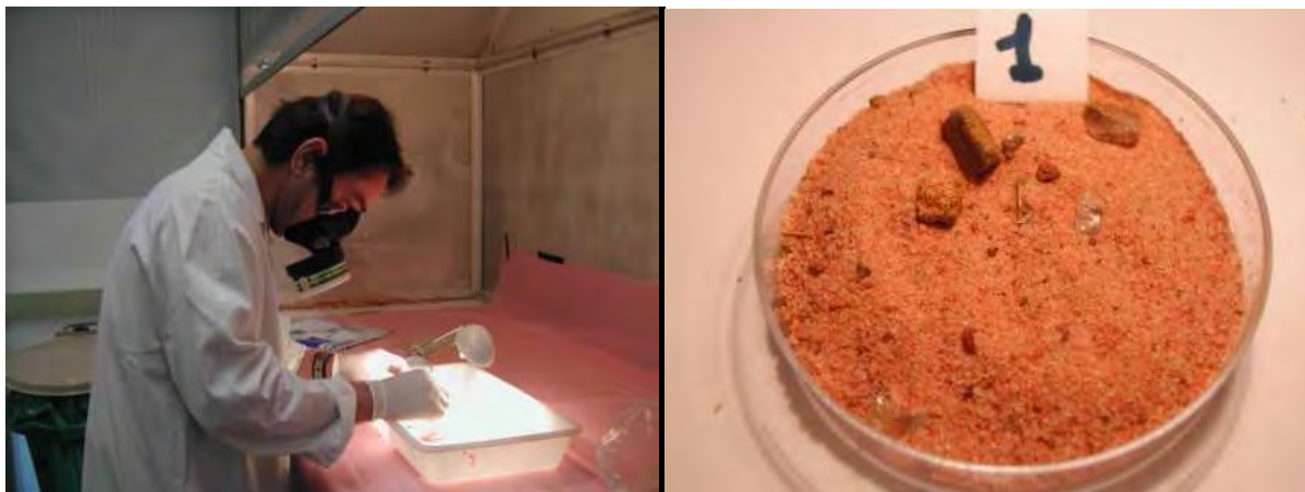
Préparation au laboratoire CRIIRAD des sols contaminés suite à l'accident de transport d'uranate de 2004

En janvier 2004 un accident de transport a fait 5 morts. De la matière radioactive s'est répandue sur la chaussée et malgré les injonctions du Centre National de Radioprotection de Niamey, l'exploitant a mis plus d'un mois pour finir la décontamination, laissant ainsi dans l'environnement des sols dont la contamination en uranium était 1 000 à 10 000 fois supérieure à la normale selon les mesures effectuées par le laboratoire de la CRIIRAD.