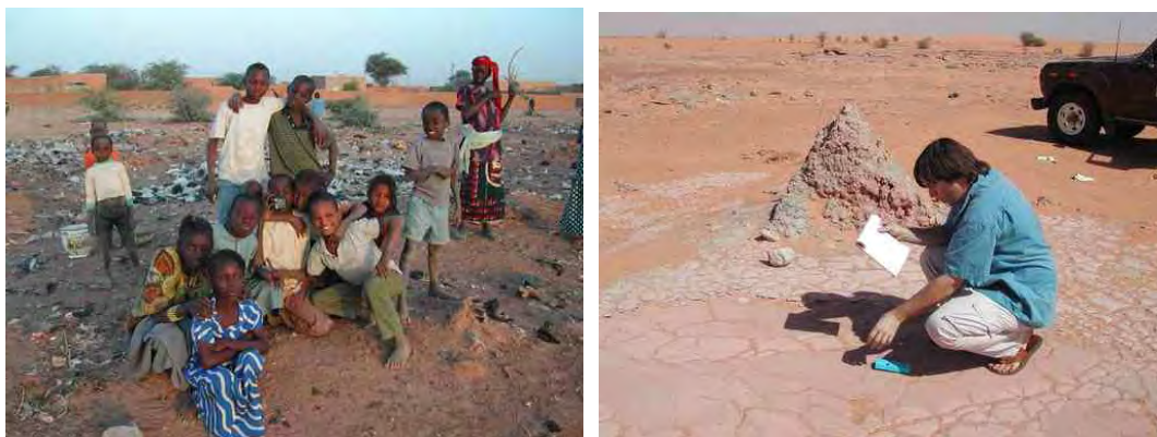
Faubourg d' ARLIT / Mesures radiométriques CRIIRAD sur boues de forage

En association avec d'autres partenaires (le gouvernement du Niger à travers l'ONAREM, le Japon (OURD) et l'Espagne (ENUSA)) la production d'uranium a commencé en 1971 à travers la filiale SOMAÏR, suivie par la COMINAK.