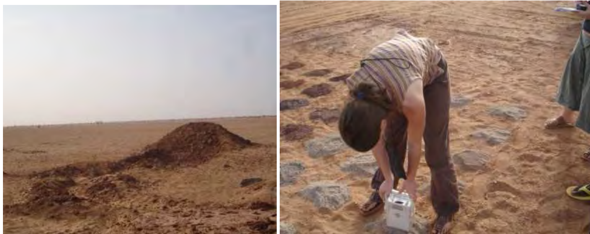
Imouraren forage 1 / forage 3

Les mesures effectuées par deux étudiantes 11 en avril 2007 dans la zone de forage d'Imouraren ont révélé des niveaux de radiation gamma 5 à 9 fois supérieurs à la normale au contact des tas de boue séchée laissés en place au droit des trous de forage (cf. photographies ci-dessous). Ces petits monticules de terre sont observables « à perte de vue » et sans aucun confinement. Ces opérations de forage conduisent donc bien à ramener des matériaux radioactifs à la surface.