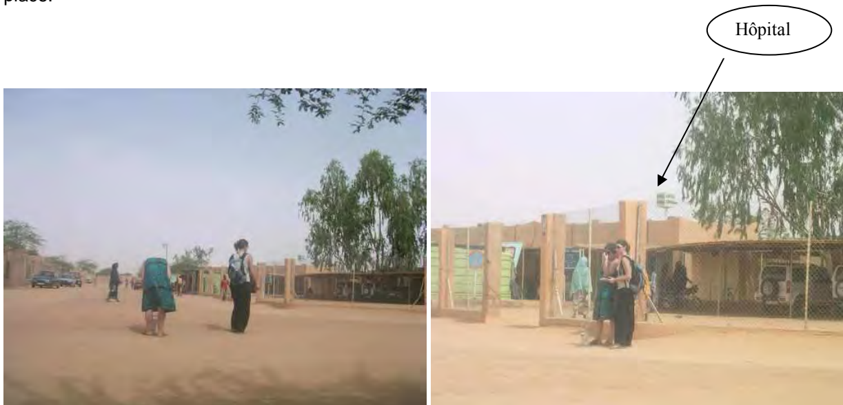
Détection de niveaux de radiation anormalement élevés en avril 2007 devant l'hôpital d'AKOKAN (source : C. Chamberland et M. Roche).

A ce jour aucune réponse n'a été apportée à la CRIIRAD et les matériaux radioactifs sont toujours en place.