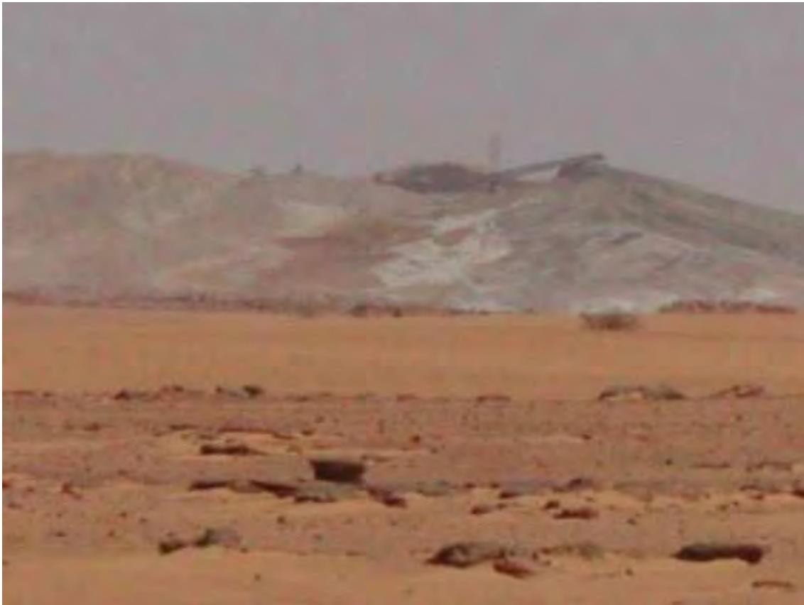
Résidus radioactifs de COMINAK (source : CRIIRAD, déc. 2003).

Il conviendrait de tenir compte également des autres types de déchets radioactifs solides (par exemple pour SOMAÏR des tas de résidus de lixiviation statique estimés à 12,1 millions de tonnes de minerai à faible teneur en uranium).