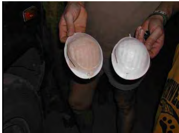
Mise en évidence du fort taux d'empoussièremment dans les rues d'ARLIT (CRIIRAD, déc. 2003).