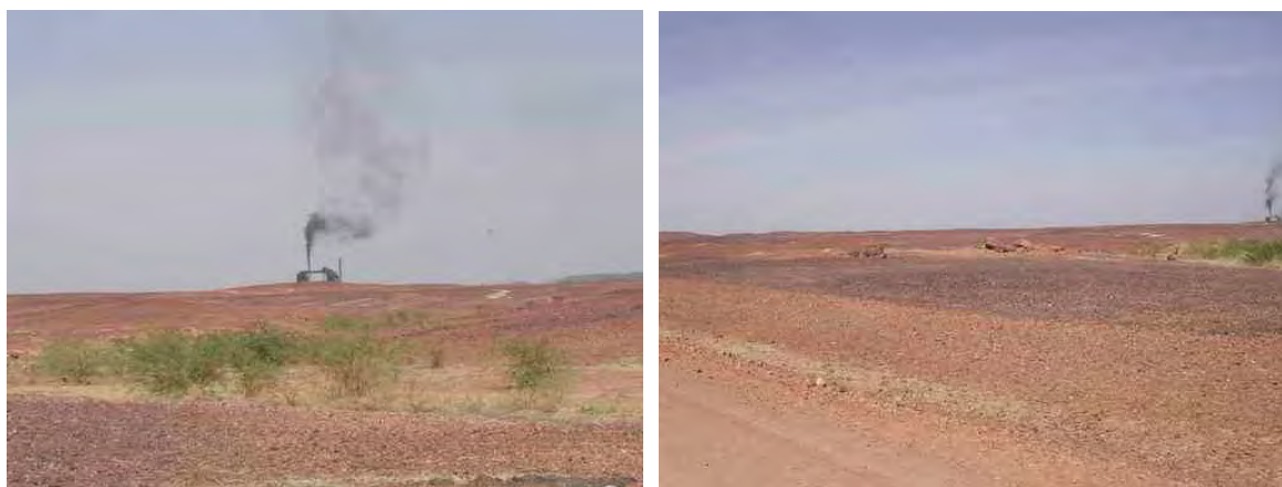
Centrale au charbon de SONICHAR, pollution atmosphérique et dépôts noirâtres au sol (CRIIRAD, déc. 2003).

Dans le cadre de sa mission de décembre 2003, la CRIIRAD a pu constater visuellement la pollution des sols (dépôts noirâtres) liée aux rejets atmosphériques de cette centrale thermique (cf. photographie ci-dessous). A Tchirozérine, la population locale se plaint d'ailleurs d'un impact sanitaire lié aux conditions d'exploitation de la mine de charbon et de la centrale thermique.