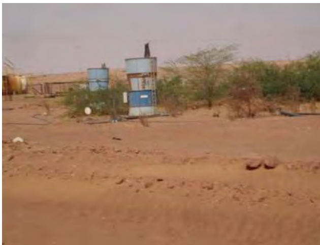
Bouches d'aérage COMINAK