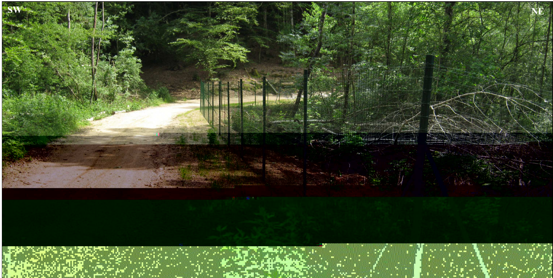
Chemin d'accès côté SE