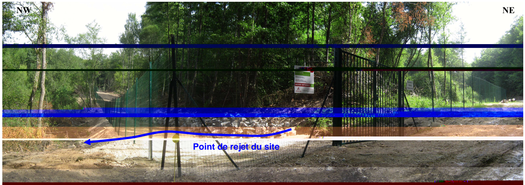
Panoramique au SW du site du réaménagement