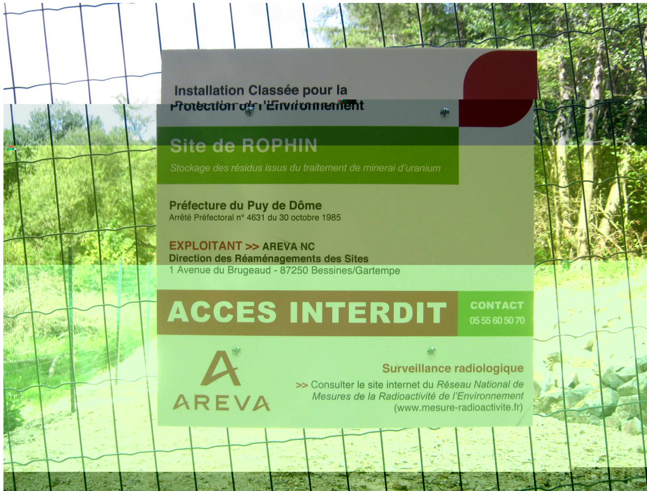
Panneau conforme à la circulaire ministérielle du 22 juillet 2009