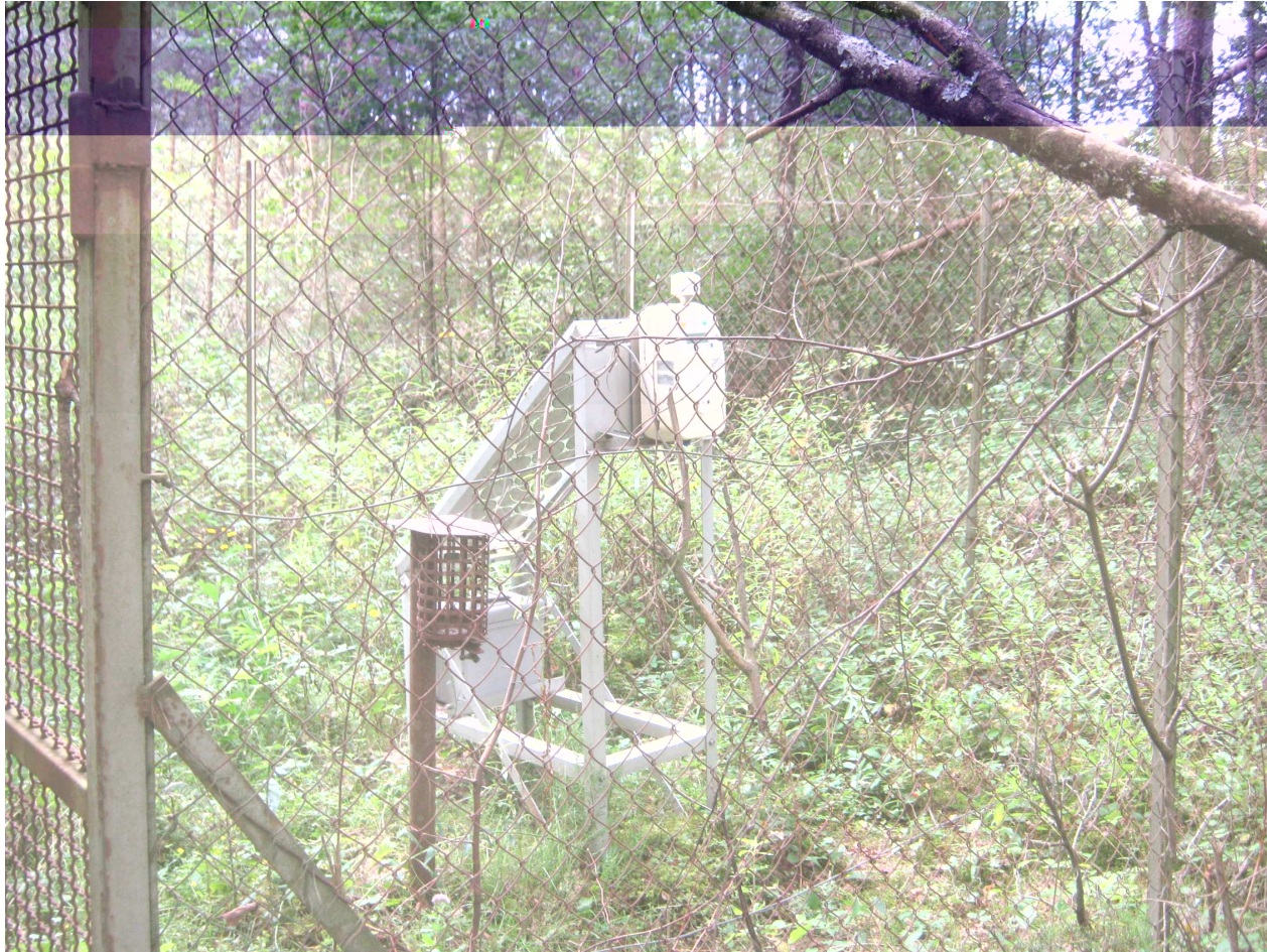
Dosimètre du site