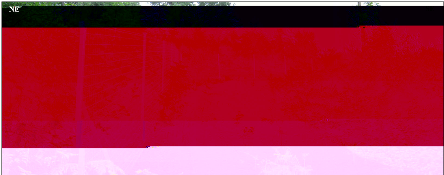
Vue de la clôture vers le Nord du site