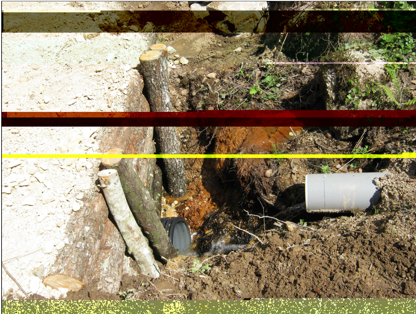
Rejet d'eau du travers-bancs et du drainage (point de prélèvement ROF PT5)