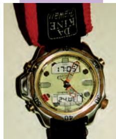
Montre radioactive : prométhéum 147

L'autorisation devrait impliquer l'information du consommateur : information préalable à l'achat et information correcte. Ce n'est pas le cas. Le site Internet de la Fédération horlogère suisse ( http://www.fhs.ch ) assure, par exemple, que "le rayonnement est parfaitement confiné dans le boîtier" ! Les tests réalisés par le laboratoire de la CRIIRAD prouvent que le tritium migre hors du boîtier. Rien d'étonnant puisque c'est un gaz (hydrogène radioactif). Si l'on place la montre au dessus d'un verre rempli d'eau (non contaminée) et que l'on attend 1 ou 2 jours, l'analyse révèle que l'eau est devenue radioactive : du tritium s'est diffusé dans l'atmosphère et dissout dans l'eau. Lorsque la montre est portée, le tritium migre à travers la peau. Une grande partie est assez rapidement éliminée avec les urines mais une partie se fixe, et pour longtemps, au cœur des cellules, et notamment dans la molécule d'ADN, provoquant de multiples lésions à chaque désintégration d'un atome de tritium.