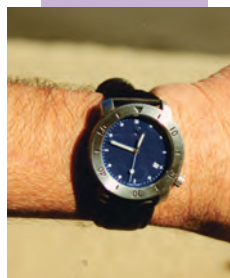
Montre radioactive : tritium